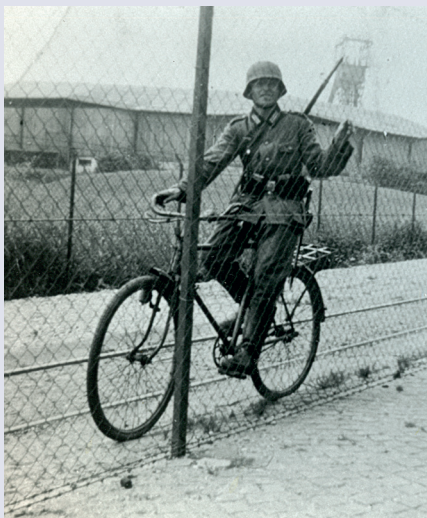
Een Duitse soldaat poseert aan de Nieuwstraat met op de achtergrond de wielerbaan en de Domaniale Mijn. / Ein deutscher Soldat posiert an der Nieuwstraat mit der Wielerbaan und der Domaniale Mine im Hintergrund

Neem ook even een kijkje bij de fotoborden op drie locaties aan de Nieuwstraat. Zij brengen opmerkelijke momenten uit de historie van de straat tot leven. De fotograaf stond destijds op de plaats waar nu het bord staat.