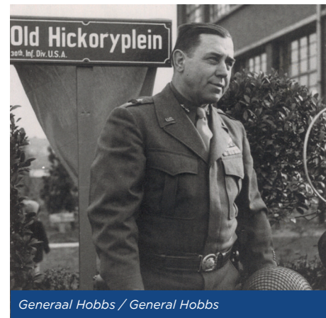
Generaal Hobbs / General Hobbs

Während der Evakuierung 1944 legten die Einwohner von Kerkrade ein Gelöbnis ab, um nach dem Krieg eine Kapelle und ein Denkmal zu errichten, an denen tagtäglich für den Frieden gebetet werden sollte. Dieses Versprechen wurde eingehalten. Dieses