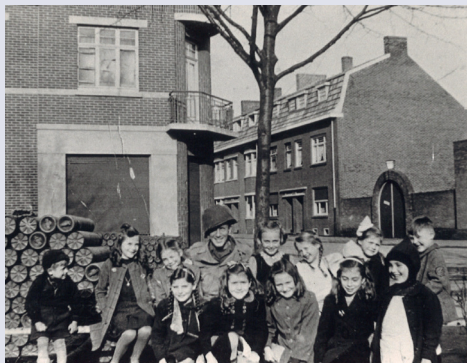
Stralende kinderen poseren in Bleijerheide voor een Amerikaanse munitievoorraad. / Strahlende Kinder posieren in Bleijerheide vor einem amerikanischen Munitionsvorrat.

Vervolg de Rimburgerweg en sla RA de Albert Thijsstraat in. In de bocht naar links ligt achter het blauwe hek van de glashandel (huisnummer 3) een herdenkingsplaquette in de bestrating.