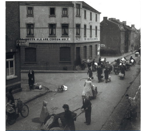
Bij de evacuatie in september 1944 lopen bewoners uit Bleijerheide langs Consum Holz / Bei der Evakuierung im September 1944 laufen Bewohner aus Bleijerheide am Consum Holz vorbei

Diese Plakette erinnert an die Evakuierung