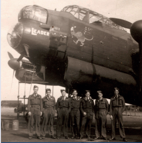
De bemanning voor de Lancaster bommenwerper, die in 1943 neerstortte. 15 / Die Besatzung des Lancaster Bombenflugzeugs, das 1943 abgestürzt ist. 15