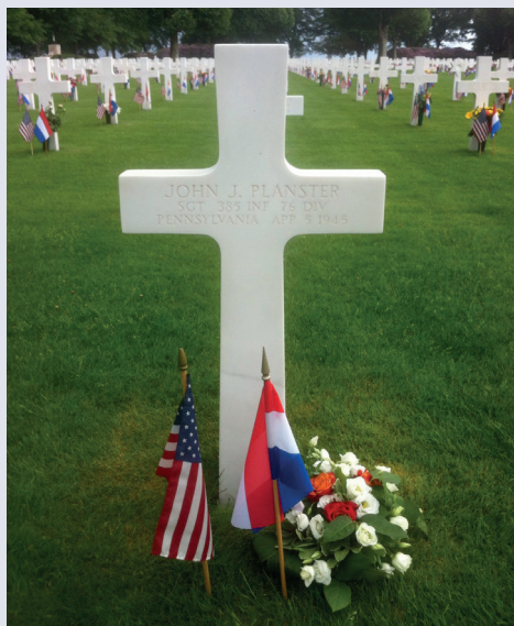
Oorlogsgraf Margraten / Kriegsgrab Margraten

In 2019 bestond de Oranjevereniging Kerkrade 100 jaar. De vereniging organiseert onder meer herdenkingen met betrekking tot de Tweede Wereldoorlog en de bevrijding van Kerkrade. Ook zijn er jaarlijks projecten voor de schooljeugd van Kerkrade en de Duitse buurgemeente Herzogenrath, met als thema 'Vredenvrijheid-verdraagzaamheid - Kerkrade grenzeloos'. Een van deze projecten is de adoptie van een graf van een Amerikaanse soldaat in Margraten. De Oranjevereniging onderhoudt eveneens nauwe banden met de '30th Infantry Division Old Hickory', de bevrijders van Kerkrade. Voor meer info: www.oranjeverenigingkerkrade.nl