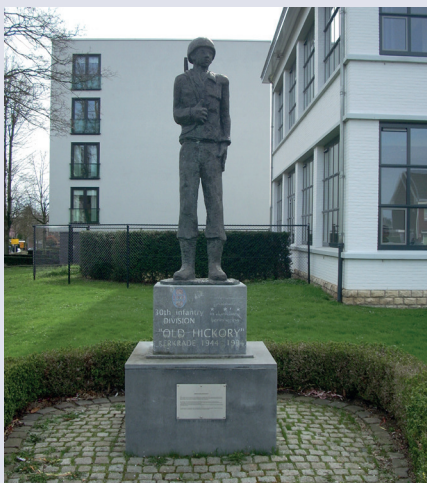
Monument voor de bevrijders van Kerkrade 7 Denkmal für die Befreier von Kerkrade 7

Sla na de schacht LA en meteen RA het geasfalteerde pad in tussen de bomen door.