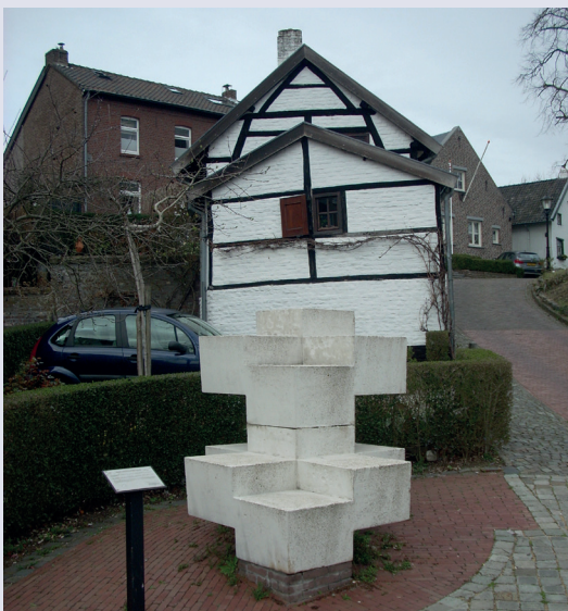
Oorlogsgedenkteken Eygelshoven 17 Ehrenmal Eygelshoven 17

Vervolg de weg RD en ga met de bocht mee LA de St. Antoniusstraat in. Neem vervolgens de Voorterstraat, die je alsm