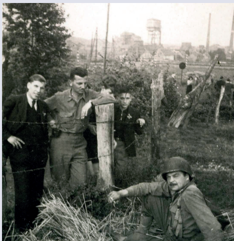
Amerikaanse soldaten in Eygelshoven, met de mijn Laura op de achtergrond. / Amerikanische Soldaten in Eygelshoven, mit der Laura Mine im Hintergrund.

Vervolg de weg en sla RA de Nievelsteenstraat in. Deze volg je tot op het kruispunt waar je LA slaat en de route volgt naar knooppunt 42. Sla bij knooppunt 42 RA naar knooppunt 22 en dan richting knooppunt 20. Na huisnummer 5 aan de Grensstraat sla je RA de Kloosterlindeweg in (steil!). Je komt terug bij het startpunt, Abdij Rolduc.