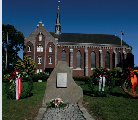
Herdenkingssteen Lancaster bommenwerper 15 Gedenkstein Lancaster Bomber 15

Fiets RD. Op de volgende rotonde staat 'D'r Knub'.