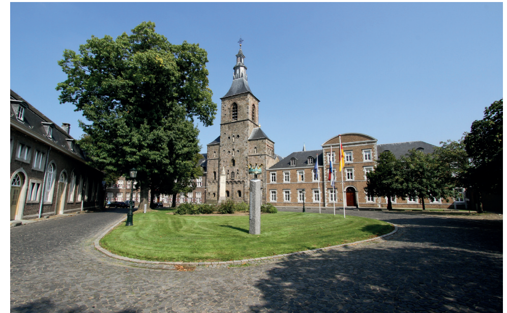
Abdijsplein / Abtei Rolduc