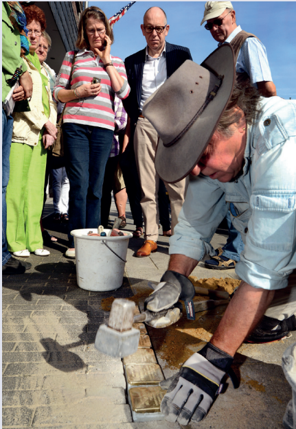
Gunter Demnig legt de Stolpersteine voor de familie Weinblum, Hoofdstraat 34. / Gunter Demnig legt die Stolpersteine für Familie Weinblum, Hoofdstraat 34

daardoor gedwongen wordt er aandacht aan te schenken. Als je met je hoofd naar beneden de tekst leest, toon je daarmee automatisch ook respect. In Kerkrade liggen op vijftien plekken struikelstenen. Sommige zijn geadopteerd door Kerkradse inwoners of verenigingen.