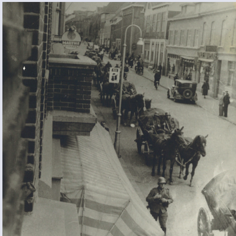
Intocht van Duitse troepen in de Hoofdstraat op 11 mei 1940. / Einzug der deutschen Truppen in der Hoofdstraat am 11. Mai 1940